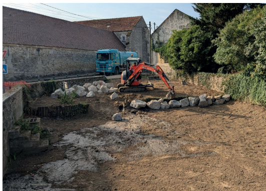
Curage et réaménagement de la mare