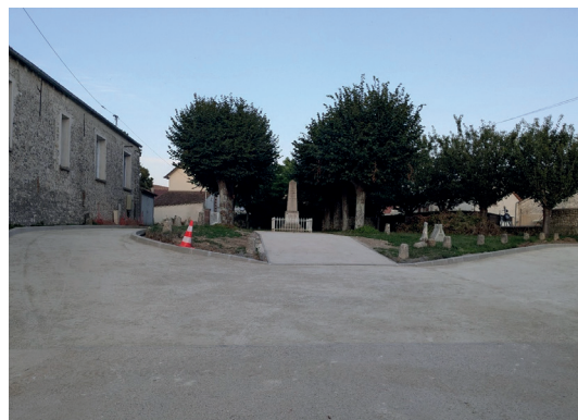
Réaménagement de la place Mainguet