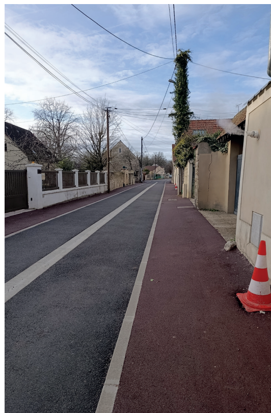
Rue des Cent arpents