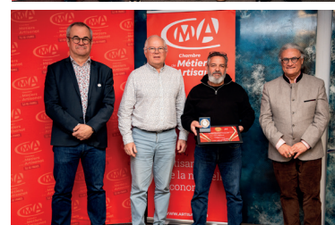
Cérémonie à la Chambre de Métiers et de l'Artisanat IDF, en présence du maire de Saint-Germain de la Grange.