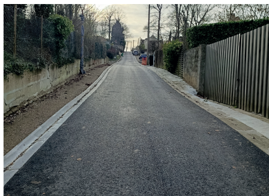
Rue des Maisons brûlées

Bien entendu, la chaussée a été totalement refaite. Les trottoirs et la signalisation seront la dernière étape.