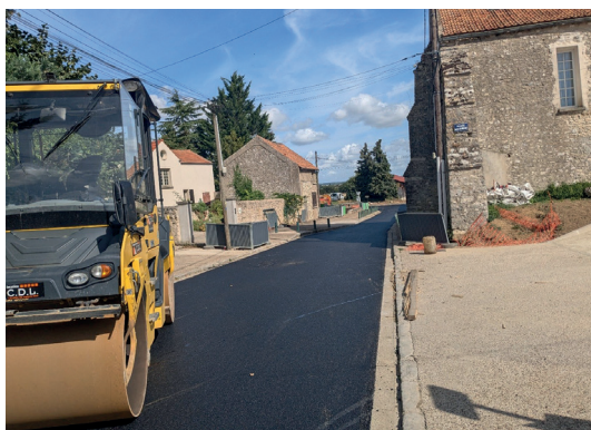
Rue de la Mairie

La place Mainguet, qui accueille le monument aux morts, a été également réaménagée, et le monument lui-même a été bénévolement et gracieusement nettoyé par un riverain. La commune le remercie sincèrement de cette initiative.