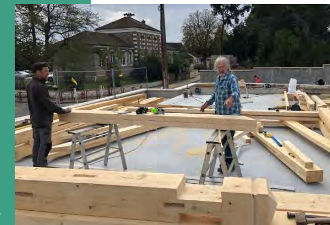
Les charpentiers ont réalisé, sur place, de façon traditionnelle, la découpe et l'assemblage de l'ouvrage sur mesure !

Depuis l'été, il y a de nouveau de l'agitation et des travaux aux abords de la mairie. Cette agitation n'est ni plus ni moins que la concrétisation du projet, annoncé, de création d'un nouvel espace couvert communal près de la place du village et des écoles. L'histoire de notre commune est rurale et agricole, et l'ancien fermier Job, le plus ancien et plus emblématique agriculteur du village, comptait dans ses annexes un hangar agricole à cet emplacement.