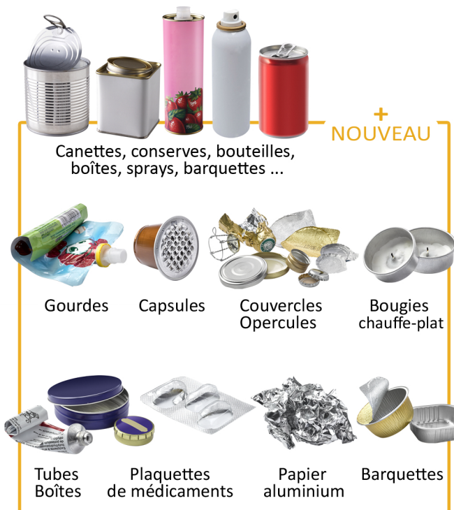
Canettes, conserves, bouteilles, boîtes, sprays, barquettes ...