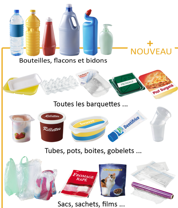
Bouteilles, flacons et bidons